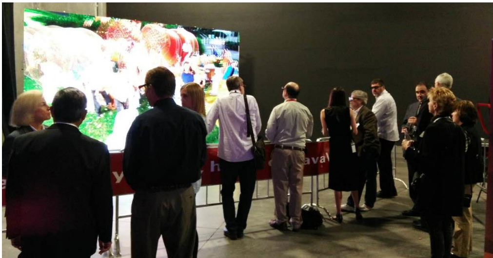
CCDL 3DLED 显示系统参加 IAAPA 会展

奥兰多位于佛罗里达州，是世界最大主题公园城市，这里有 30 多个主题公园，如迪斯尼、环球影城、海洋世界、六面旗等大型娱乐公司在这里都有主题公园，其中迪斯尼乐园全球共有六个，规模最大的就在奥兰多，名为迪斯尼世界，面积为 100 多平方公里，为香港迪斯尼乐园的 97 倍，或者上海迪斯尼乐园的 31 倍。因此可知，奥兰多是世界著名旅游城市之一，是大人带着小孩来度假的最佳城市。郑州中原显示技术有限公司、中显三维技术（北京）有限公司（CCDL）携偏振型 LED 3D 显示系统参加了于 2016 年 11 月 15-18 日在奥兰多举办的“IAAPA（International Association of Amusement Parks and Attractions 国际游乐园协会）”会展，全世界各大主题公园、娱乐场所及其设计公司和系统集成公司都参加了会展。