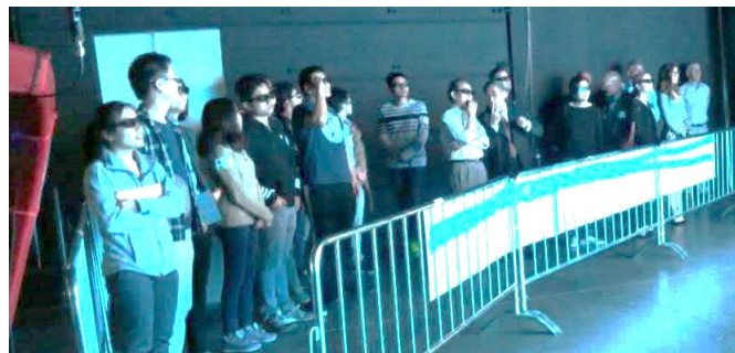
中佛罗里达州大学吴教授带领研究生前来观看并现场教学

重要的是：这些大型主题公园均为主打少年儿童娱乐的公司，他们意识到了 3D 设备必须是健康显示的重要性，这对于保护少年儿童的身心健康是十分必要的，并通过观看 CCDL 的偏振型 LED 3D 显示系统反观了现行投影机 3D 以及电子快门型 LED 3D 显示系统的严重缺陷。他们的设计公司和系统集成公司如著名游乐园设备集成商 Dynamic Attractions 陪同他们一起前来进行了详细的咨询。17 日和 18 日，迪斯尼、六面旗、海洋公园均再次前来，其中迪斯尼派出了 30 人的代表团对于 CCDL 的 3D 大屏幕进行了详细专题考察，17 日下午，世界著名显示专家、显示技术协会 SID 的授奖委员会主席、中佛罗里达州大学吴诗聪教授率 12 名研究生前来参观并现场讲学，“取得了特别的效果”，18 日下午，德国宝马公司的显示技术工程师专程由法兰克福飞来奥兰多与李超教授进行近距离观看 3D 效果、以立体显示的方案在宝马总部展厅展示新一代宝马轿车的探讨，意大利的一家飞机驾驶员培训机构向李教授提出了使用 CCDL 3D 显示系统作为飞行模拟器主显示系统的设想，其他的各个 VR 公司也与李教授探讨了在其 VR/AR/MR 系统中使用 LED 3D 显示系统作为 3D 背景显示方案的可行性。此次会展的参加取得了很大的成绩，现场做出了多项方案设计，各种大小工程将会接踵而来。